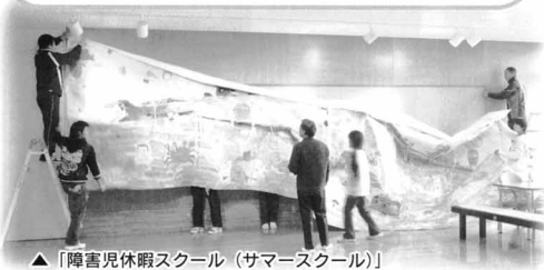
▲「障害児休暇スクール(サマースクール)」 みんなで作成した「大きな絵」を展示中(あすてらすエントランスホール)