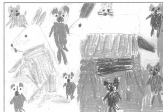
▲じょいわーくの利用者 K.Kさん作