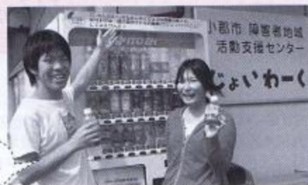
赤い羽根自動販売機の設置協力者も募っています