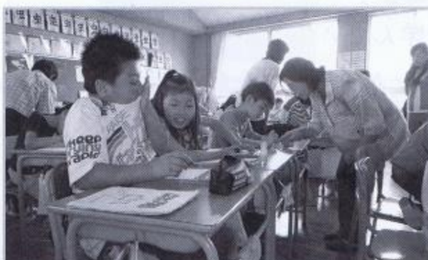
▲東野小学校4年生 点字学習の様子(6月28日) 蛍の会の方4名に講師として指導いただきました。 「点字を見たことがありますか」の問いかけに「駅、歩道、シャンプ ーやリンスのボトル」などたくさんの答えに、福祉への関心の高さを 感じました。点字学習に一生懸命、取り組んでいました。