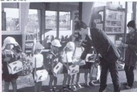
▲H24.10.1 松崎駅前街頭募金活動