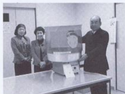
▲綿菓子機の寄贈 地域行事に引っ張りだこです。