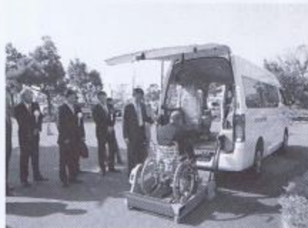
▲障がいのある方の送迎等に活用