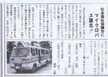
(社協だより/昭和51年1月1日号)