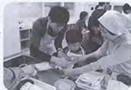
(あやつ作りの様子)

その中でも、ボランティアの方々のご協力はとても大きな支えとなっています。障害児(者)福祉に関心のある高校生以上の方のボランティアを募集しますので、よろしくお願いいたします。