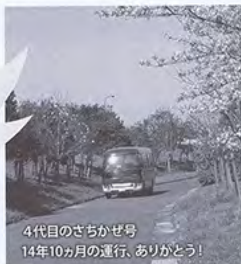
4代目のさちかぜ号 14年10ヵ月の運行、ありがとう!

小郡市社会福祉協議会では、1975年(昭和50年)、福祉団体や市民の強い要望を受け福祉バス運営を始めました。