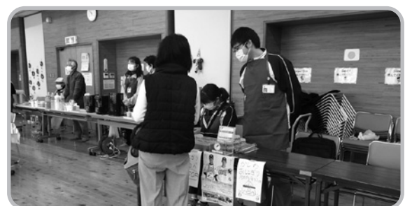
くろつちカフェで募金活動