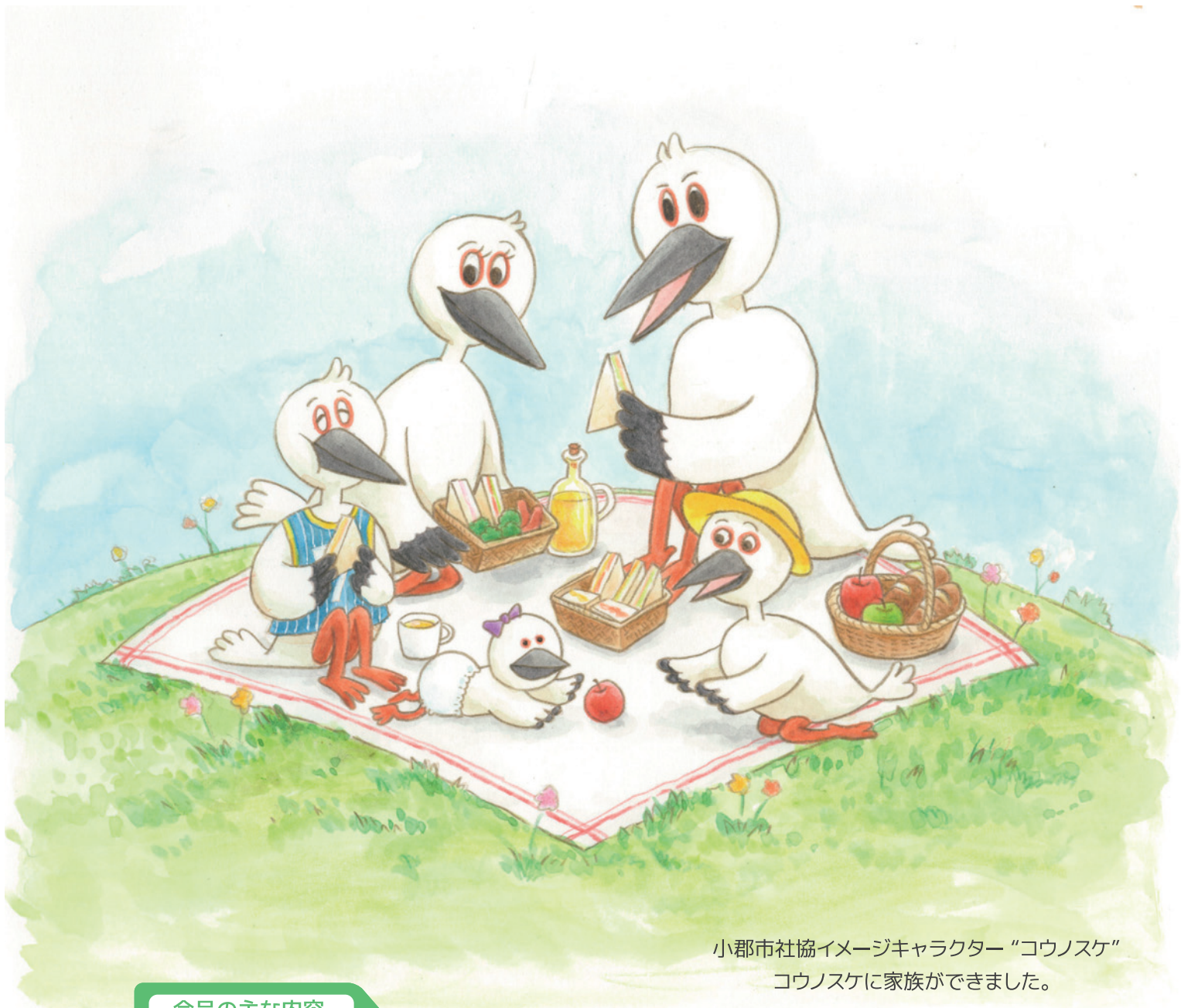
小郡市社協イメージキャラクター“コウノスケ” コウノスケに家族ができました。