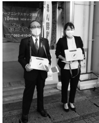
街頭での募金活動の様子

10月1日、朝夕の通勤通学の慌ただしい時間帯にも関わらず、街頭募金へのご協力ありがとうございました。