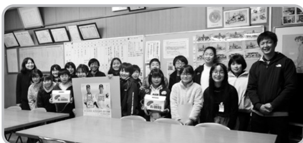
小郡小学校の皆さん

共栄資源管理センター小郡 小郡スイミングスクール 小郡校 三国校 みんなのかえるランド フラワービギン テンガイ For you サロンヘア・ドゥ 髪工房らびっと 理容つかさ きぼうの家 小郡大刀洗広域 シルバー人材センター 九州歴史資料館 三井消防署 三井水道企業団 埋蔵文化財調査センター 小郡交流センター ポピーの里あじさか館 稲穂の里みはら館 緑の里くろつち会館 のぞみがおか生楽館 ふれあい館三国 ひまわり館東野 大原きぼうの森館 大崎教育集会所 二夕集会所 下岩田市民館 大原リバティセンター 小郡市野球場 小郡市役所 あすてらす総合受付 社会福祉協議会 受付窓口 ボランティア情報センター 福祉バス