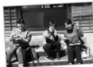
昨年のスプリングスクールの様子