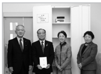
久留米法人会より寄贈▶