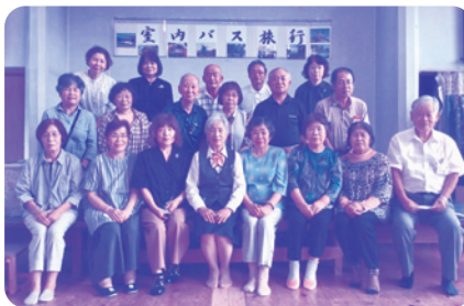
ガイドさんと旅行の記念撮影

会場は感染予防に気を配り、歌あり、笑いあり、涙ありの室内バス旅行は喜びの中、無事に終える事ができました。