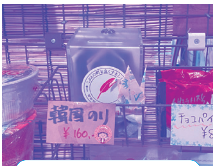
設置募金箱の協力 コムタン様

このような状況の中、「困ったときはお互い様」の気持ちから始まった共同募金運動は、「自分の町を良くするしくみ」として、今日に受け継がれています。