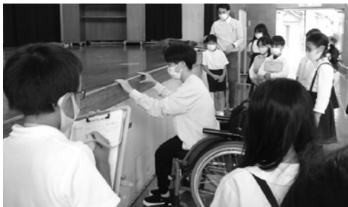
「何かにつかまると、ゆっくり立ち上がることができるよ。」と見せていただきました。