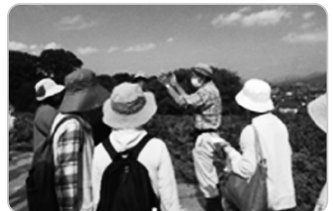
▲秋の樹木と山野草を楽しむ会