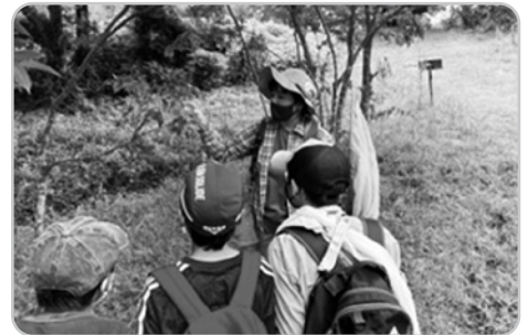
▲イベント『夏休み生き物探検』