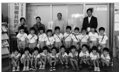
みすず保育園 ゆめ組さん▶