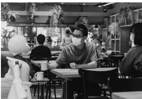
東川さんが働くカフェの様子