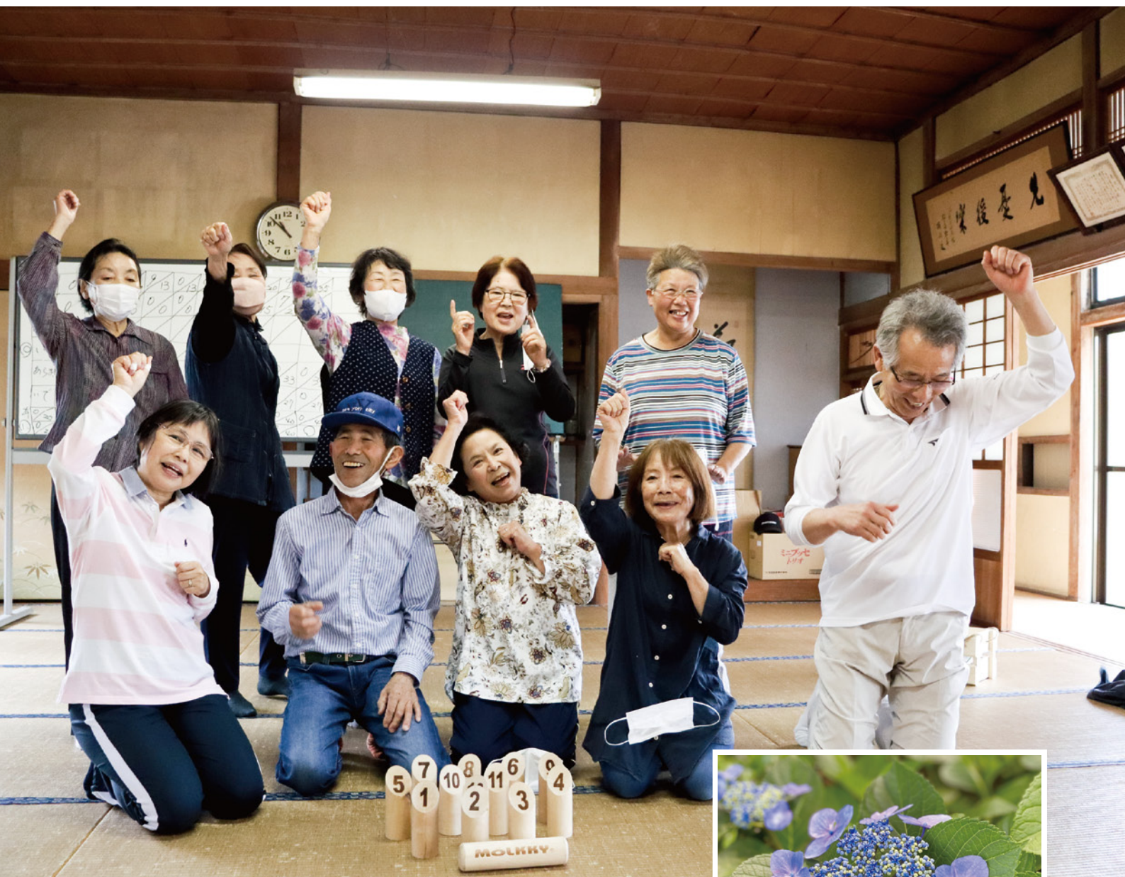
平方区ふれあいネットワーク活動 (5月12日 撮影)