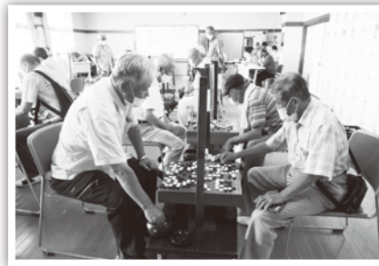
*小郡市老人クラブ連合会 ☎0942-73-2595 事務所：生涯学習センター内

将棋は、やや複雑で、成績が悪かったり、一定の年齢に達すると、引退するルールがあるそうです。将棋界の最年長現役記録は、「ひふみん」の愛称で知られ、77歳5ヶ月まで現役を続けられた、加藤一二三 九段（83歳）です。 私たち老人クラブには定年制度はなく、囲碁、将棋の愛好家も多くあります。地域で練習と申すか、アマ棋士同志が打つ手を楽しみながら親交を深めています。日頃の対局の成果を発表する機会として、 ・ 囲碁大会（7月25日 火曜日） ・ 将棋大会（7月31日 月曜日） を開催します。盤の上でぶつかり合う勝負は、脳トレ、ストレス解消と自らの健康維持につながっています。 囲碁・将棋を楽しまれている