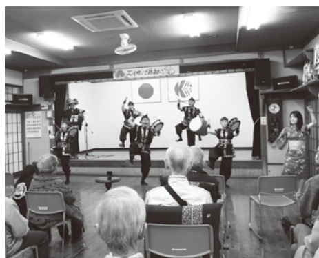
令和3年12月 サロンは、感染対策を施しながら開催。