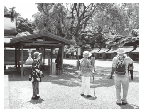
令和元年9月 バスハイクで外出を楽しむ。